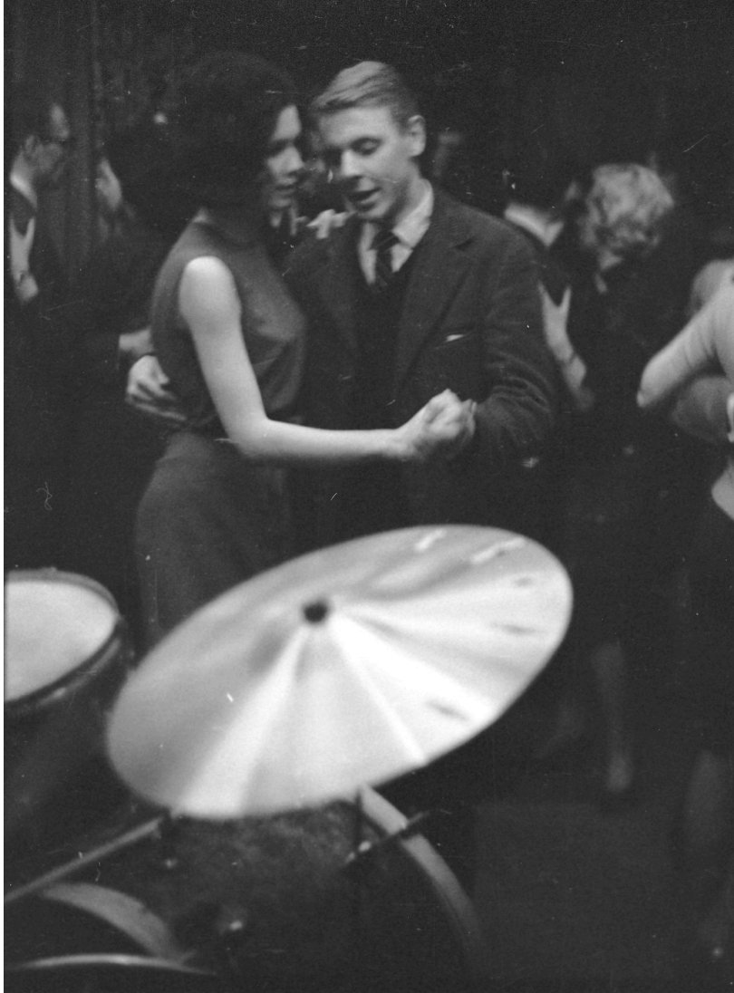
Narodowe Archiwum Cyfrowe

W latach 50. jazz był dla Polaków synonimem wolności i formą buntu przeciwko szarzyźnie panującej w komunistycznym kraju. Otwierając Pierwszy Ogólnopolski Festiwal Muzyki Jazzowej w Sopocie w 1956 roku, Leopold Tyrmand wypowiedział słynne słowa: „W tej chwili (...) jazz jest już wielką epoką w dziejach muzyki (...), ponieważ wyraża radości i smutki naszego pokolenia”.